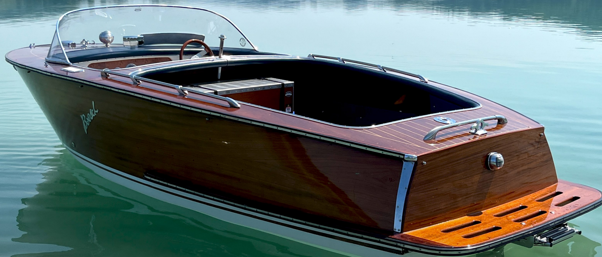
Boesch 510 Sport Deluxe Bj.1965 – der Klassiker mit Stromtriebwerk